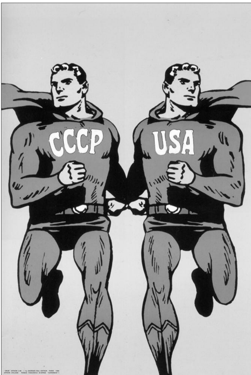
*** - Concurență