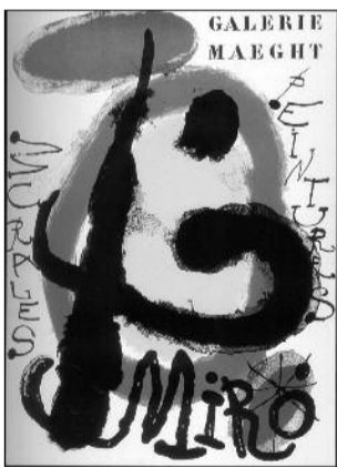
JOAN MIRO - Afis pentru expoziția proprie